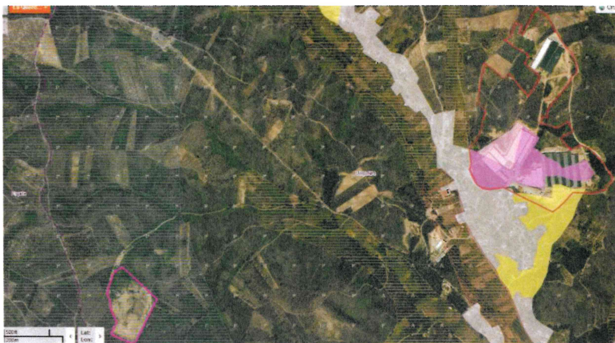
Figura 1: Pretensão – Pedido de Interesse Público

---- No âmbito do DL n.º 165/2014, de 5/11, a exploração Aviários do Resouro – Produção de Ovos, Lda solicitou a regularização e ampliação da Exploração Pecuária de Classe 1, para a Criação Intensiva de Galinhas Poedeiras e Recria de Galinhas Poedeiras, localizada na Rua do Aviário, em Resouro, da freguesia de Urqueira, do Concelho de Ourém, cuja entidade licenciadora é a DRAPLVT.-----