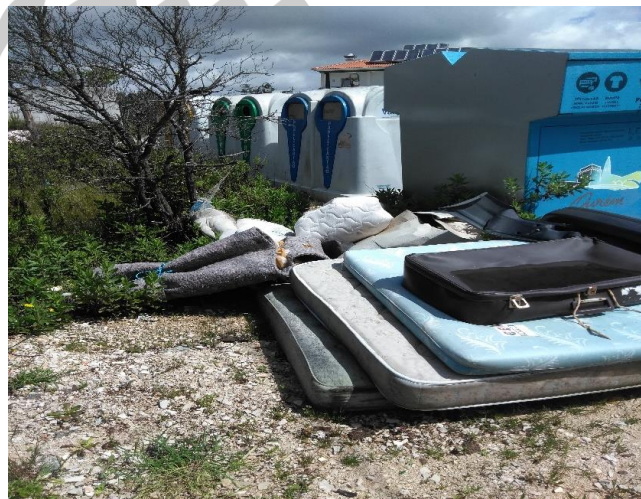
Figura 1: Recolhas não Programadas e Programadas