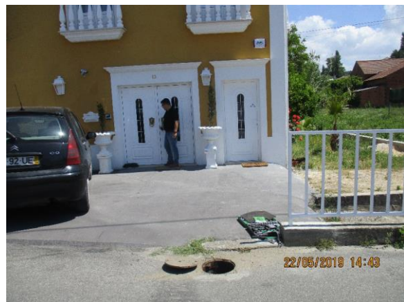
Figura 2: Vistorias a Ramais e Ligações