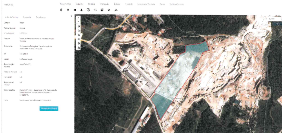
Figura 1: Pedreira em fase de regularização – Casal Farto n.º 2 (limite vermelho)